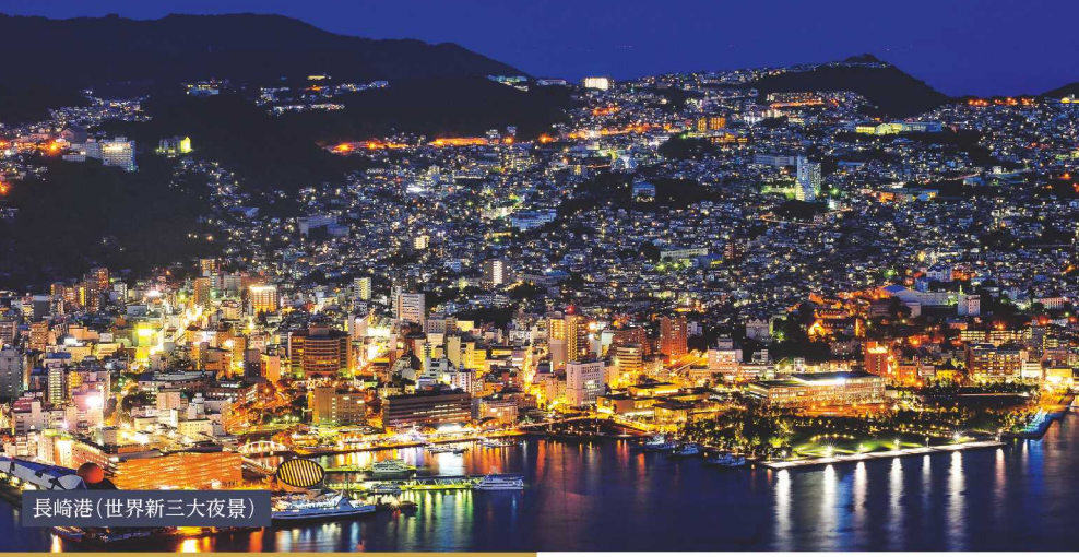
長崎港(世界新三大夜景)